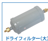
ドライフィルター(大)