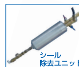
シール除去ユニット