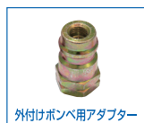
外付けポンプ用アダプター