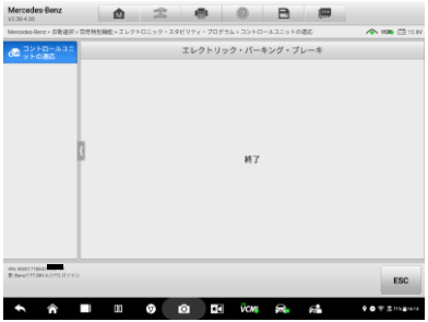
8. パッド交換終了後続行を押していただく 作業が終了します。