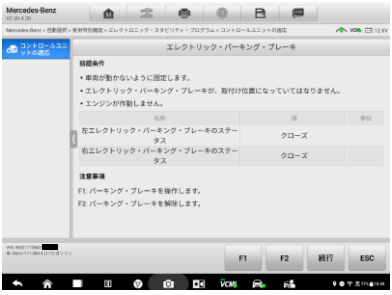
4. F1を選択するとパーキングブレーキは解除されます。 パッド交換ができる状態です。