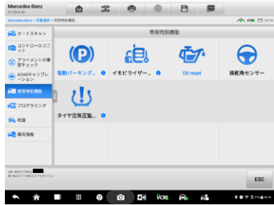
1. 常用特別機能⇒電動パーキングブレーキを選択