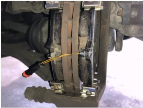
5. パッド交換時の写真