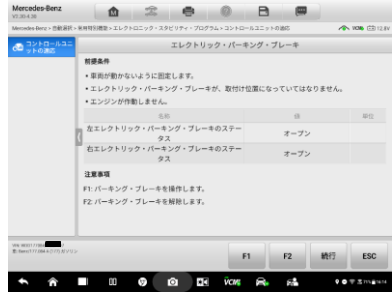
3. エレクトリック・パーキング・ブレーキを選択