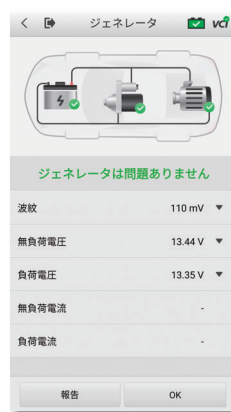
充電・始動システム診断結果