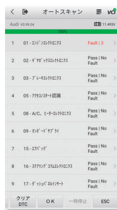
自動スキャンでDTC取得