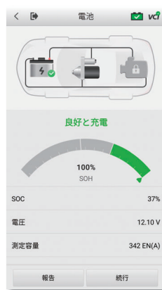
バッテリー診断結果