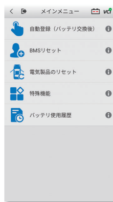
バッテリーリセットメニュー